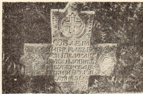
Крстац из Губереваца

„1816 лето када је на чуку народа сала сиша и србија са себо аланц, скинула и вајадинава снаг повикал и србија турке потисла тад је покори Борбе доапо о турски путника сеам рана а помену га каменорезач Дамитр и Алаз синови его сином тучилом 1867“ (Са Ружичиња гробља, Горачићи)