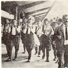
У возу „Братство-јединство“

Шеснаести Драгачевски сабор својих трубаача одржан је од 27. до 29. августа 1976. године. Надметало се 16 орнестара.