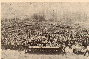
Грувачка надметања прати увек препуно сабориште

сковани и Врњанци тако дуго споре — „Море пушка из густо орас“ гче су српски осветници убили чувеног синика Абдул Ђерица агу, угрпос саветима