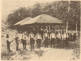
Пред музејом илдробника и крајпштана